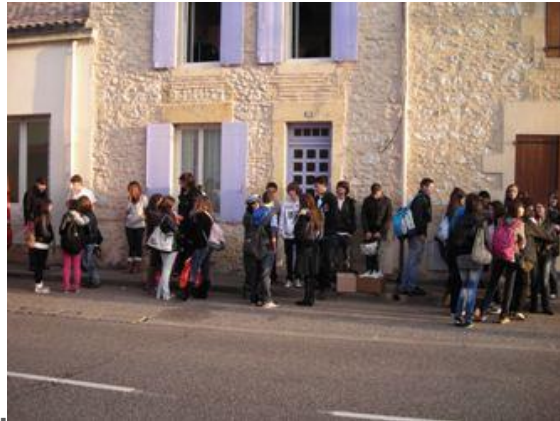
EN ATTENDANT LE DEPART, AVENUE JOFFRE A MARMANDE

Depuis 17 ans, le lycée de la Compassion est en relation avec le Colegio Santo Domingo de Silos à Saragosse et chaque année un échange a lieu entre une vingtaine d'élèves des deux établissements.