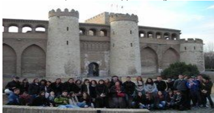
DEVANT LE PALAIS DE LA ALJAFERIA A SARAGOSSE

Que de découvertes pour tous au cours des visites certes mais aussi en partageant la vie des familles pendant quelques jours. Découverte d'un pays, d'une région ; une invitation à s'ouvrir aux autres, une joie d'accueillir et la reconnaissance d'être accueilli comme de vrais amis. Des jeunes qui continuent de correspondre et des familles aussi qui entrent en relation. Un échange, c'est plus qu'un voyage touristique, partager des activités, c'est la découverte d'une vie, c'est faire l'apprentissage de la rencontre.